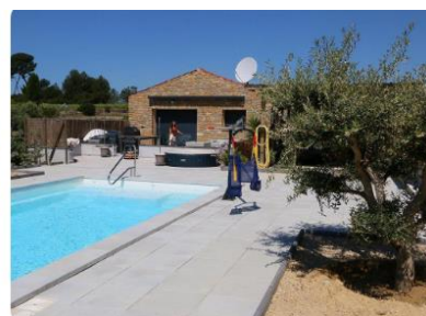
Magnifique gîte adapté PMR - Saint Cyr sur Mer Saint-Cyr-sur-Mer, France