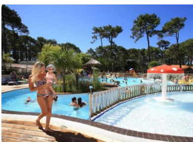
Camping familial 4* à Biscarosse - adapté PMR