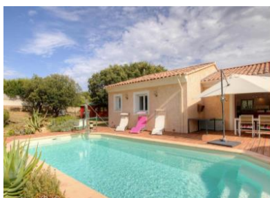
Magnifique villa adaptée PMR à Monticello Monticello, France